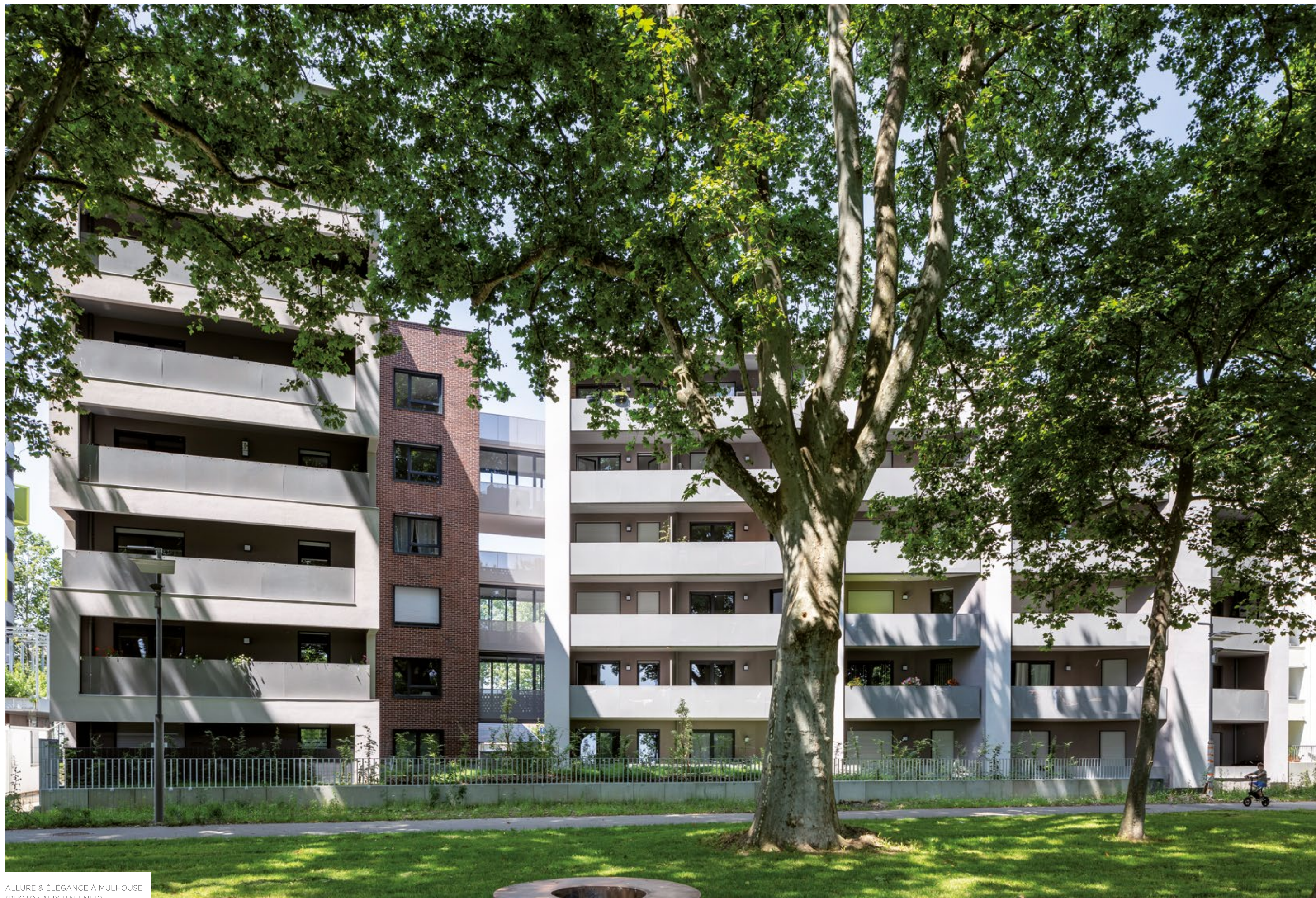
ALLURE & ÉLÉGANCE À MULHOUSE